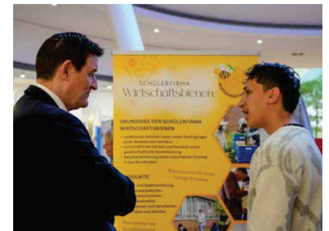
Die Schülerinnen und Schüler gingen aktiv in den Austausch mit den Organisatoren und Besuchern und zeigten ihre unternehmerischen Stärken

Die Schülerfirmenmesse machte deutlich, welchen Bildungswert solche Projekte haben. Neben fachlichen Kenntnissen erwerben die Jugendlichen wichtige Schlüsselkompetenzen: Kommunikationsfähigkeit, Teamarbeit, Selbstständigkeit und Problemlösungskompetenz. Zugleich tragen viele Projekte auch soziale oder nachhaltige Aspekte in sich – ein wichtiger Beitrag zur Bildung für nachhaltige Entwicklung. Dass Schülergenossenschaften für ihr Engagement bereits mit einer nationalen Auszeichnung gewürdigt wurden, unterstreicht diese Bedeutung. Für viele der Beteiligten bietet die Arbeit in Schülerfirmen zudem eine wertvolle Orientierung für den weiteren beruflichen Weg.